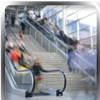
Public Liability | INSURANCE