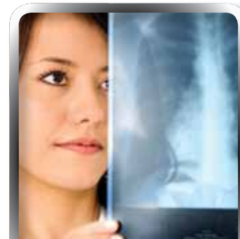
Medical | INSURANCE