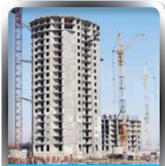
Construction & Engineering | INSURANCE

In a world full of risks, Saudi National Insurance Company provides wide range of insurance coverage that would ensure the financial security to its customers through the advisory services provided by experts with the provision of insurance coverage tailored to the needs of each client.