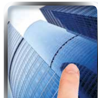
Property | INSURANCE

CR: 28735 P.O. Box 31516 Manama Kingdom of Bahrain TEL: +973 1756 3377 FAX: +973 1756 4243 Email: sinc.bh@snic.com.bh www.snic.com.bh