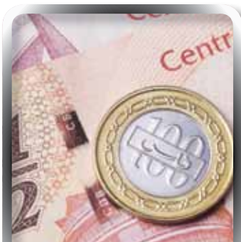
Money | INSURANCE