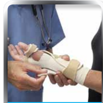
Group Personal Accident | INSURANCE