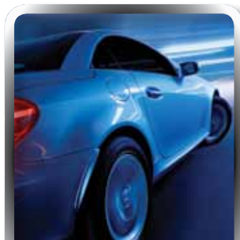
Motor | INSURANCE