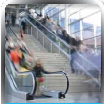
تأمين المسؤولية العامة