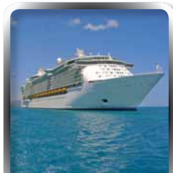
Marine | INSURANCE